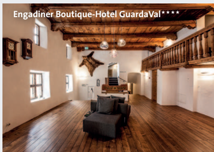
Engadiner Boutique-Hotel GuardaVal****